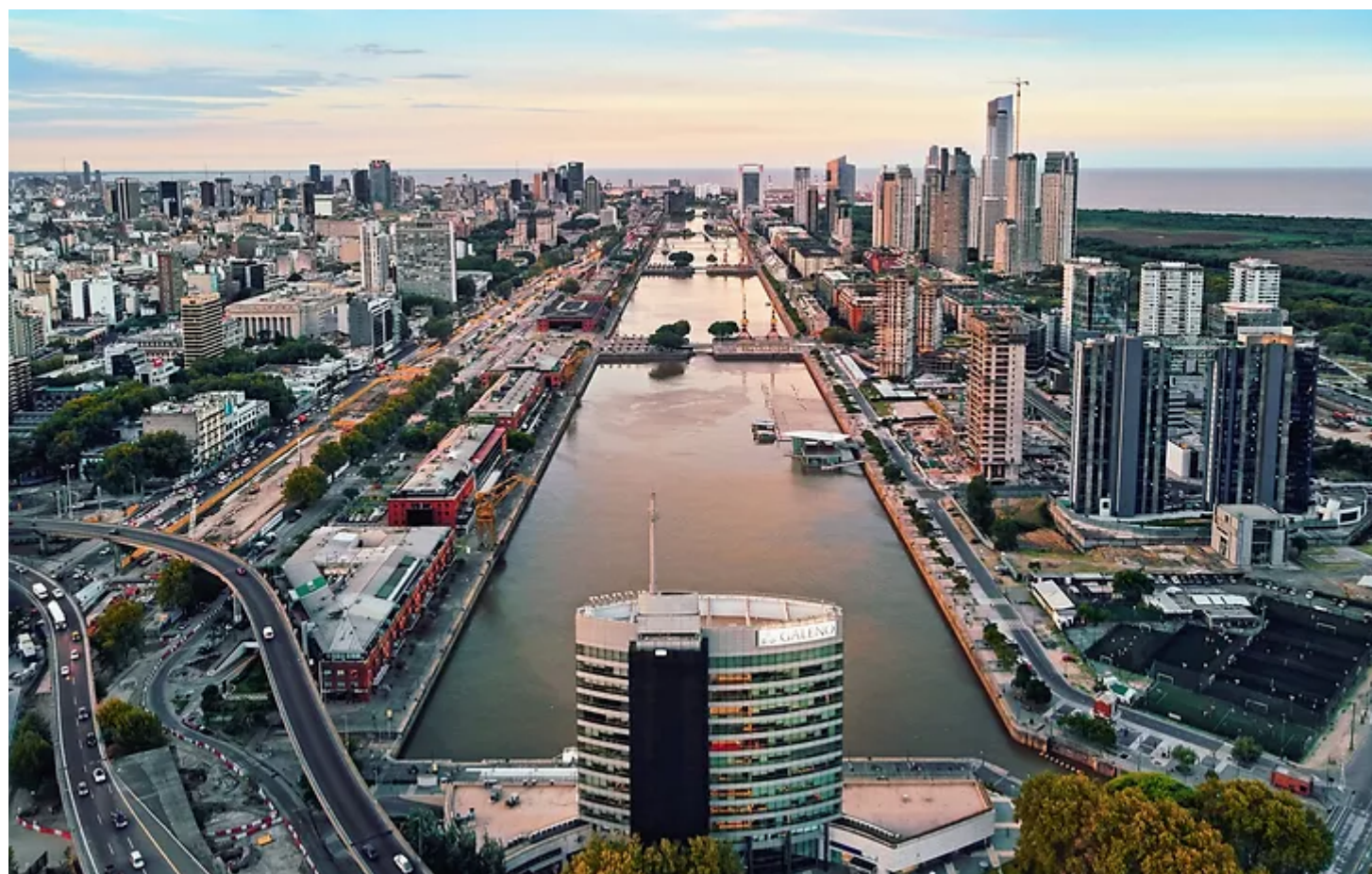
Buenos Aires