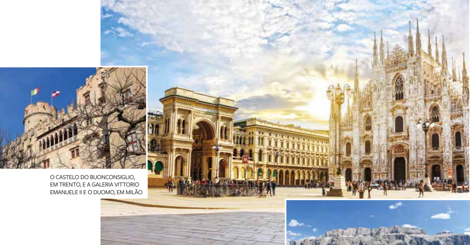
O CASTELO DO BUONCONSIGLIO, EM TRENTO, E A GALERIA VITTORIO EMANUELE II E O DUOMO, EM MILÃO