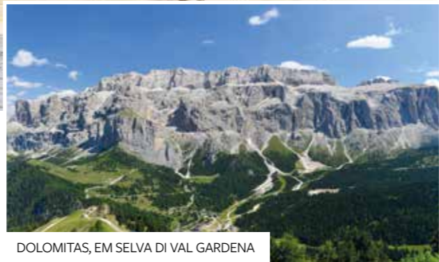
DOLOMITAS, EM SELVA DI VAL GARDENA