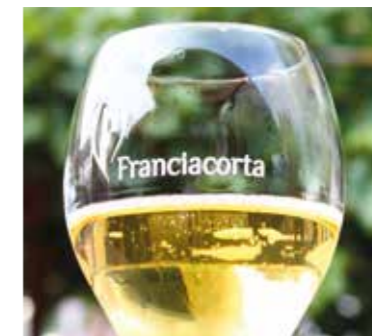
O FAMOSO ESPUMANTE DE FRANCIACORTA E SIRMIONE, ÀS MARGENS DO LAGO DE GARDA