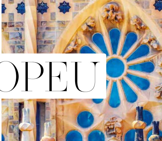
DETALHE DA SAGRADA FAMÍLIA E A FACHADA DA CATEDRAL, AMBAS EM BARCELONA. ABAIXO, A PONTE SAINT-BÉNÉZET, NA CIDADE DE AVIGNON

Uma mescla de atrações culturais com traços romanos, árabes, judaicos e catalães em três países e um principado, todos repletos de arte, religiosidade e cenários deslumbrantes