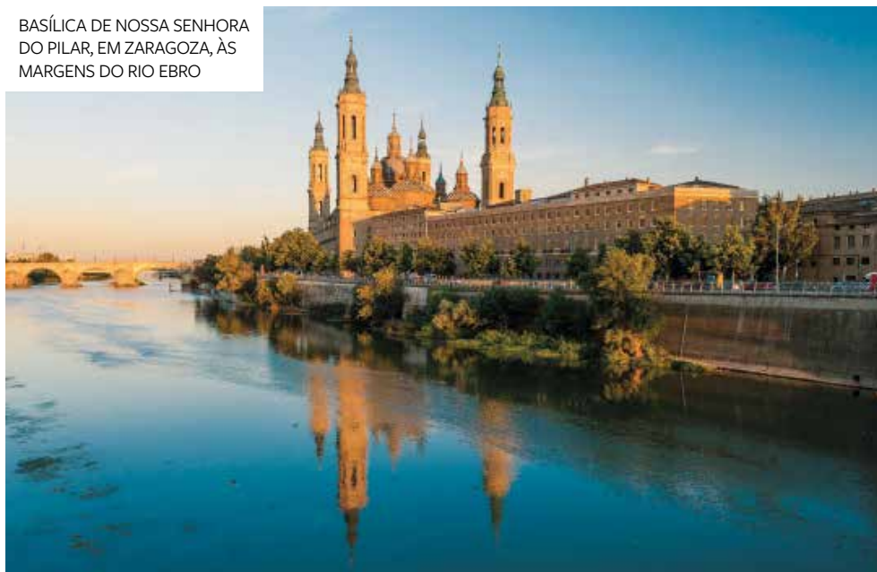
BASÍLICA DE NOSSA SENHORA DO PILAR, EM ZARAGOZA, ÀS MARGENS DO RIO EBRO

Visita panorâmica (com guia local) da capital do Cristianismo no século 14. O passeio inclui o Palácio dos Papas, a Catedral de Notre-Dame des Doms e a famosa Ponte de Avignon (Pont Saint-Bénézet). Percorrendo a Provença, uma das regiões mais encantadoras e autênticas da França, viagem para Nice, cidade cosmopolita da Costa Azul.